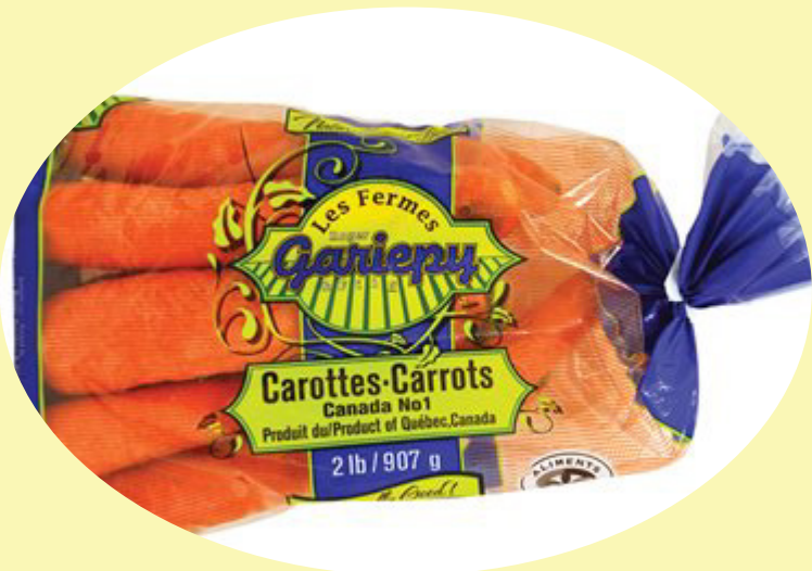
Carotte 2 lb Québec