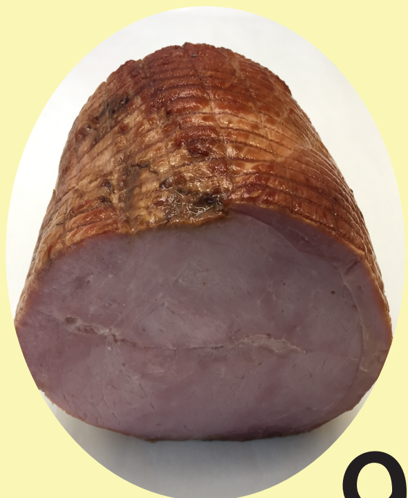
Jambon a l'ancienne fumé extra-maigre 22.02$/kg