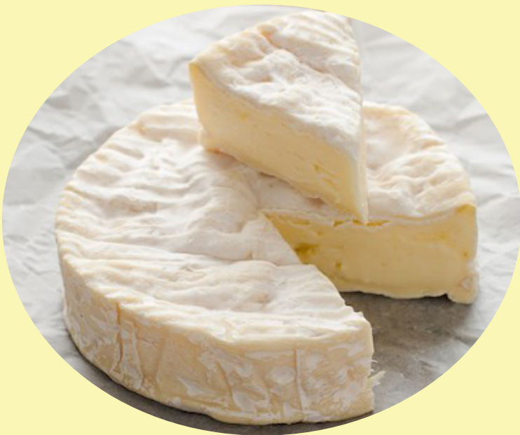
Brise du matin Portneuf 37.46$/kg