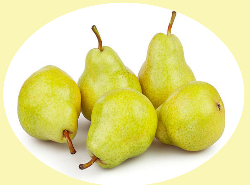
Poire bartlet États-Unis 5.49$/kg