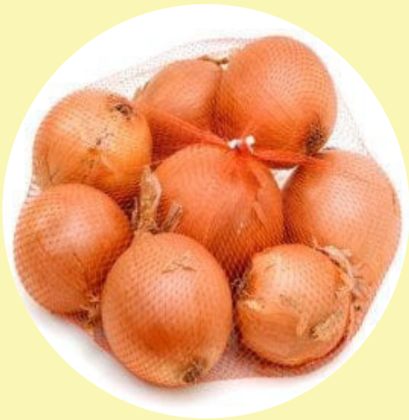
Oignon 2 lb Québec