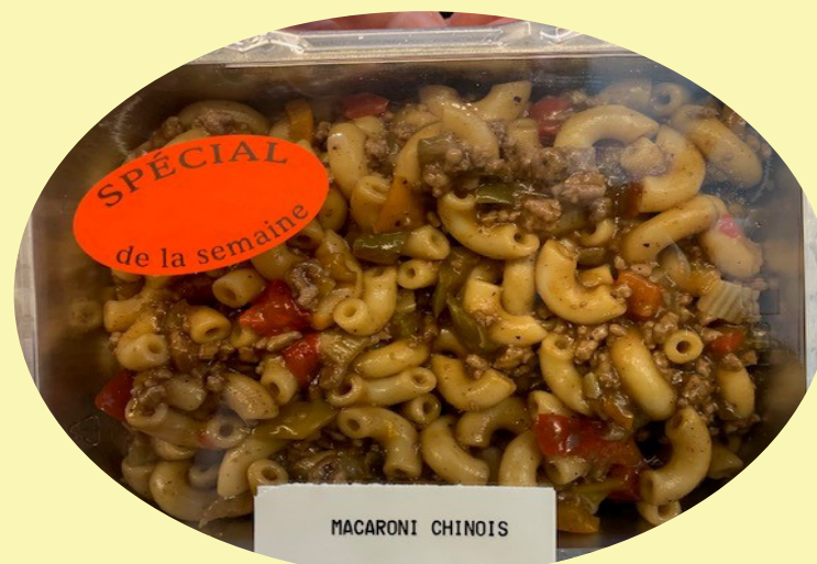
Macaroni chinois 19.82$/kg