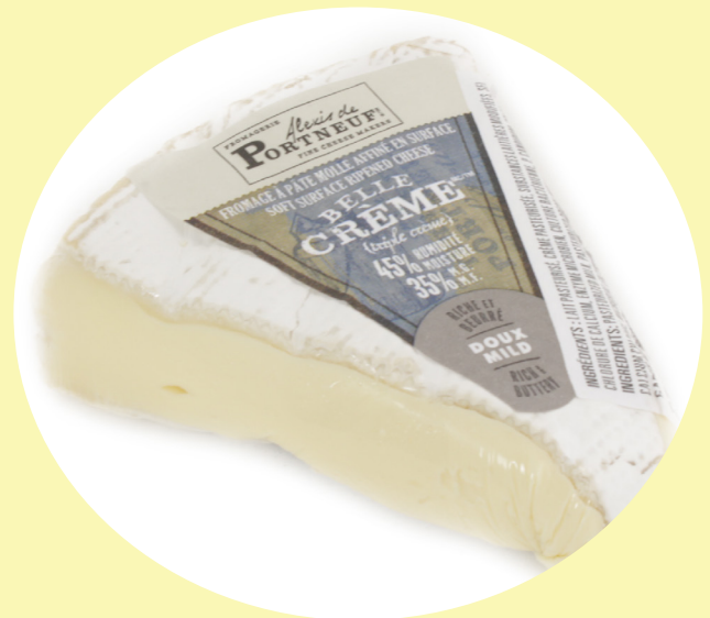
Brie Belle crème Portneuf 35.25$/kg