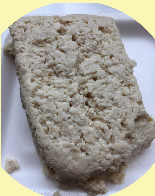
Cretons porc Maison la corne 19.81$/kg