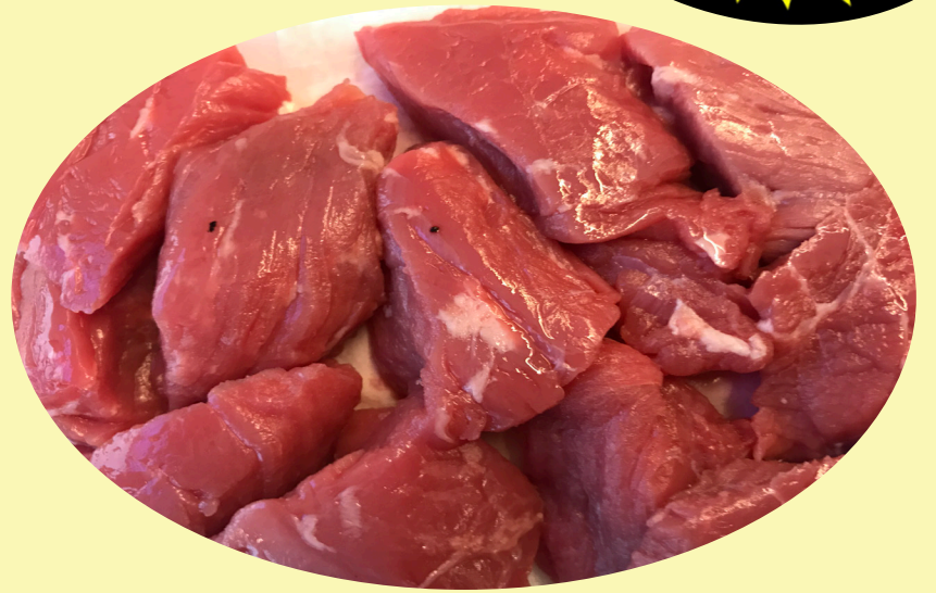
Boeuf fondue bourguignonne 29.99$/kg