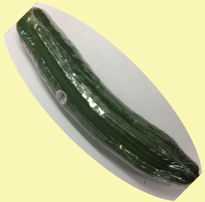
Concombre anglais Canada