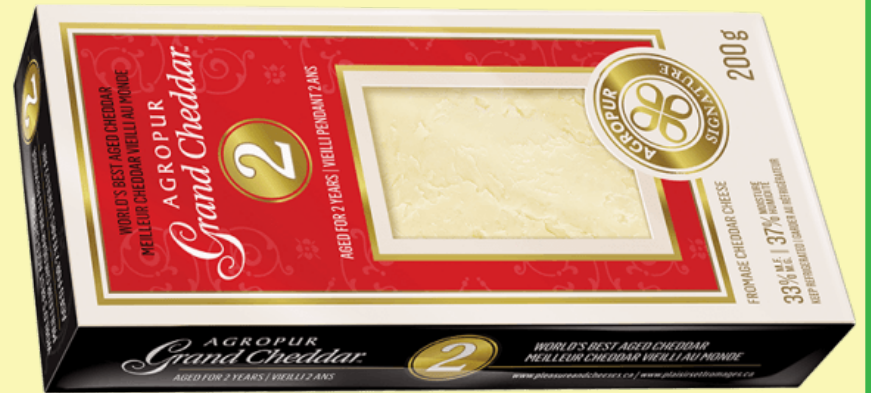
Grand cheddar 2 ans 200g