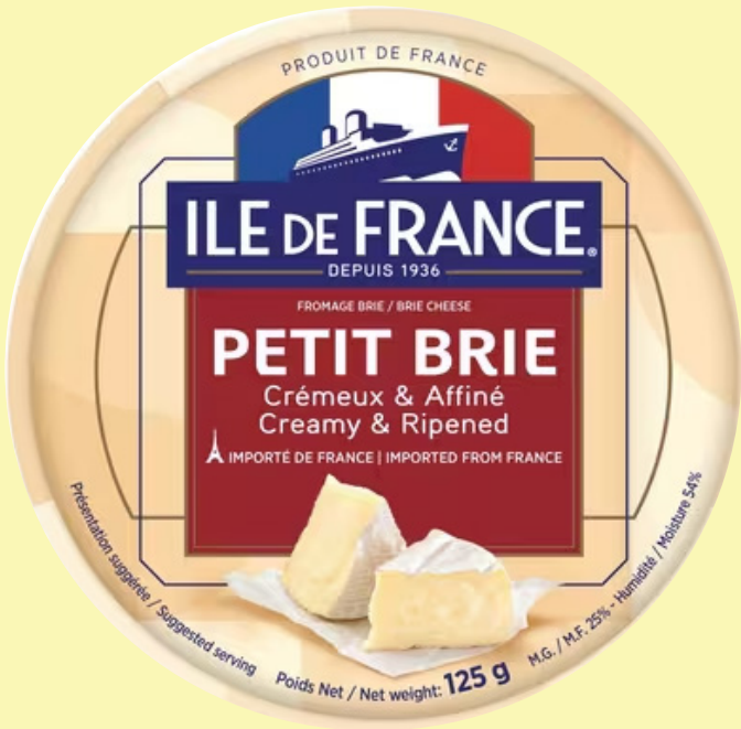
Brie Île de France 125g Agropur