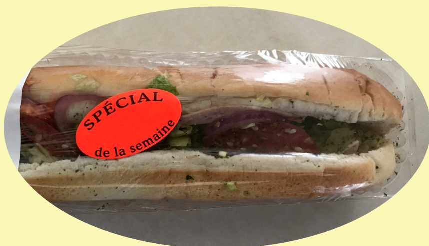
Sous-marin estival 225g