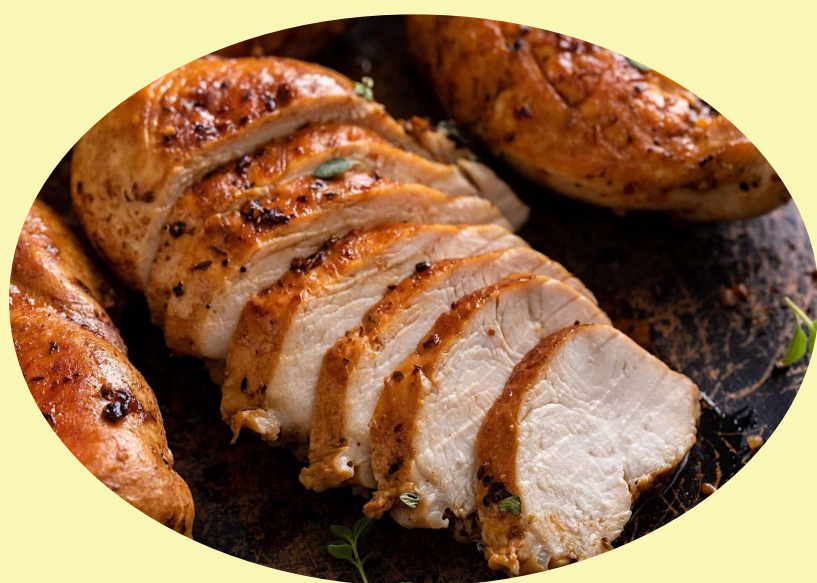
Poitrine de poulet cuite (33.04$/kg) Épice BBQ ou nature