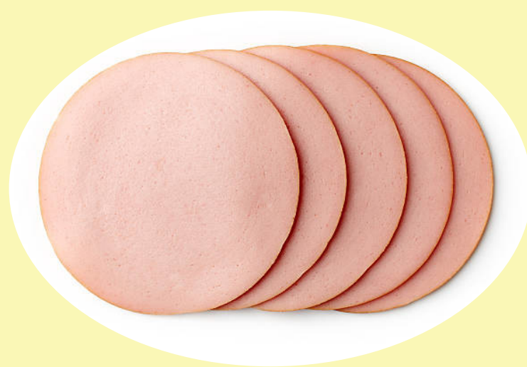
Bologne saucisson regulier (Lester) 13.21$/kg