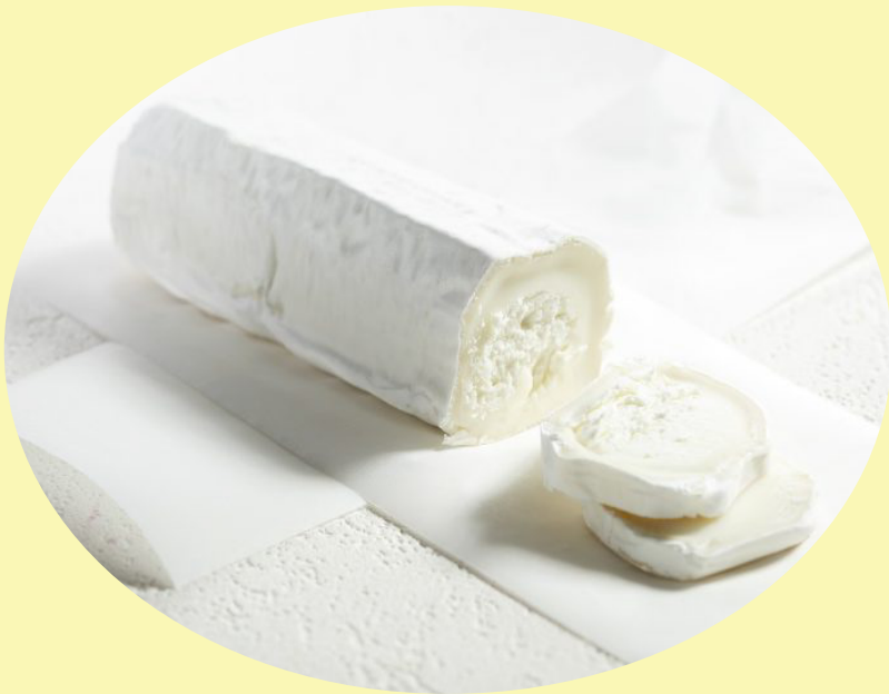
Buche St-Maure Agropur