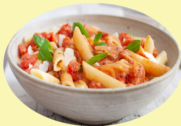
Salade penne rosée 19.82$/kg