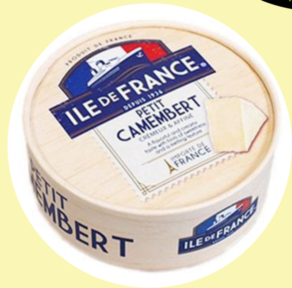
Camembert Île de France 125g Agropur