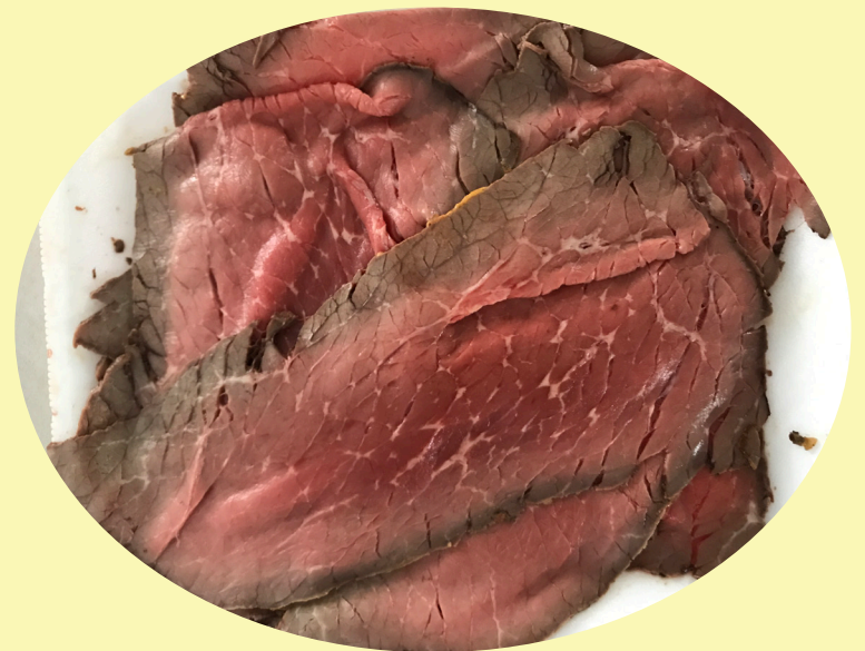
Rosbif boeuf cuit 39.99$/kg