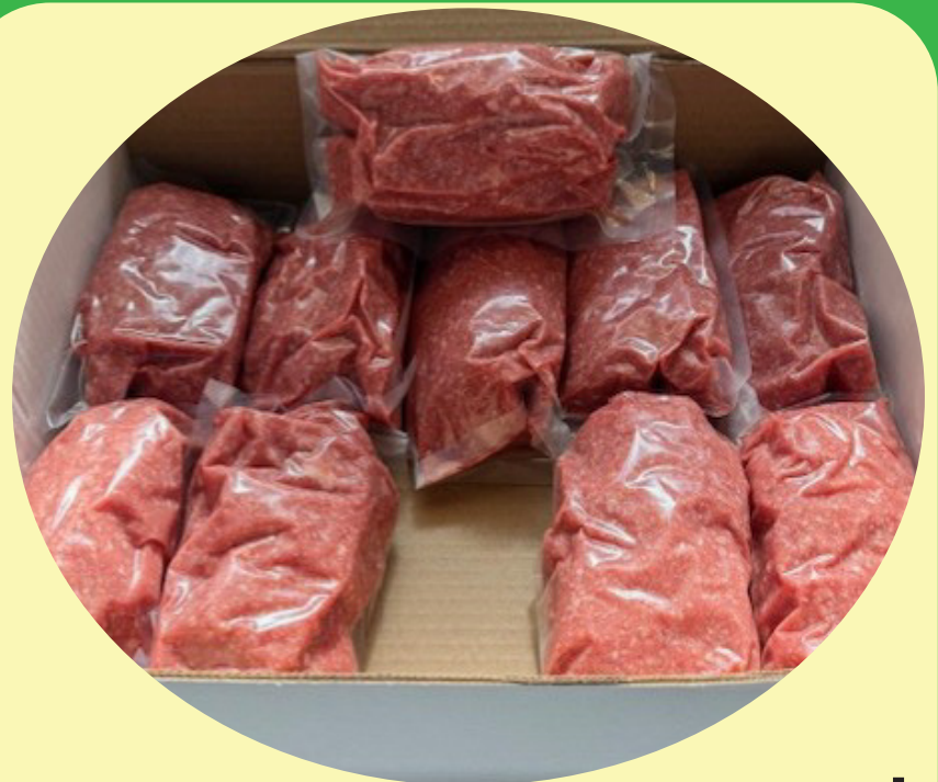
Boeuf haché mi-maigre congelé 10 x 1 lb