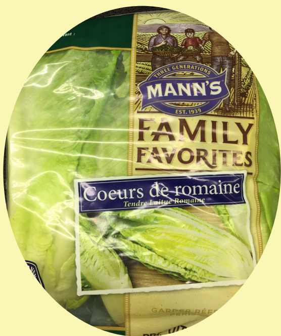
Coeur romaine États-Unis