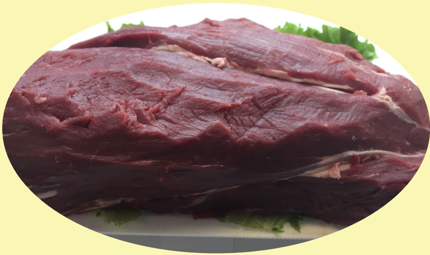
Filet mignon complet 59.99$/kg