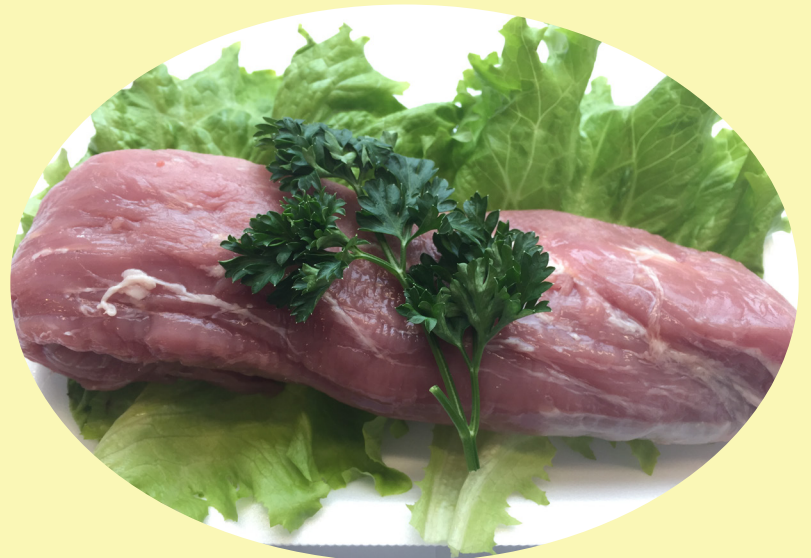
Filet mignon de porc frais 17.61$/kg