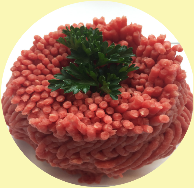
Boeuf haché mi-maigre de 2.5 lb