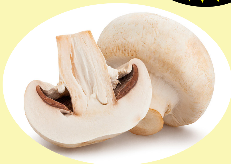
Champignon 227g Ontario