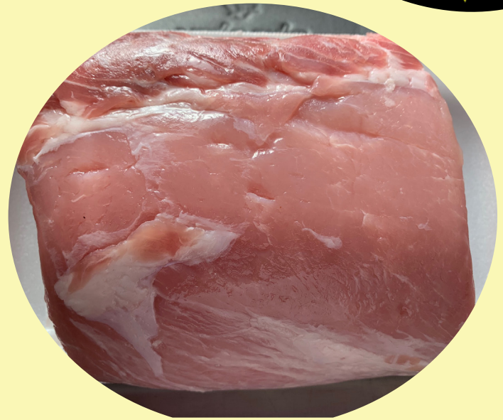
Rotie porc bout filet desossé 8.80$/kg