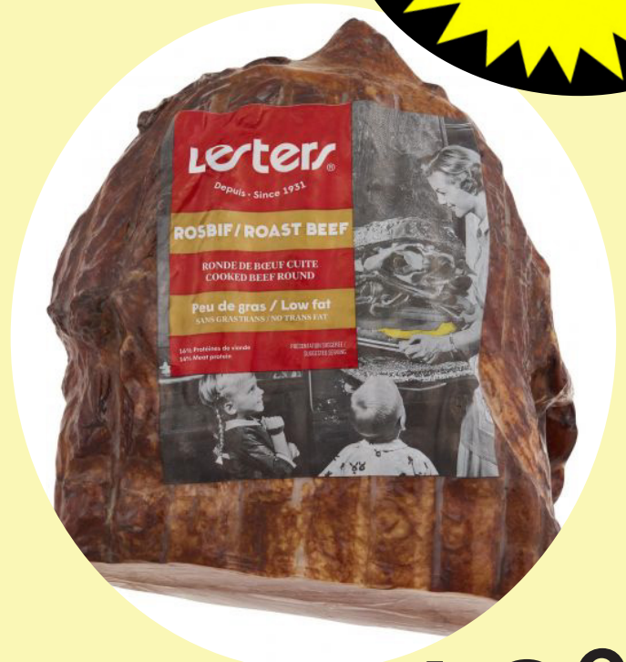
Roast beef cuit Lesters 44.07$/kg