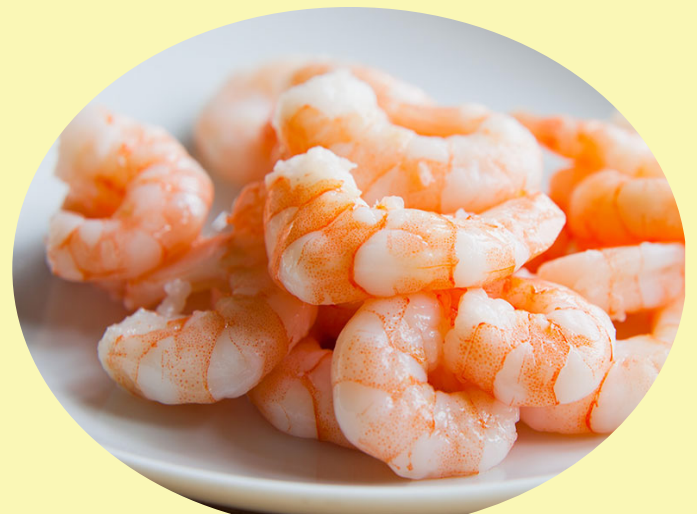
Crevettes 150/250 matane 35.99$/kg