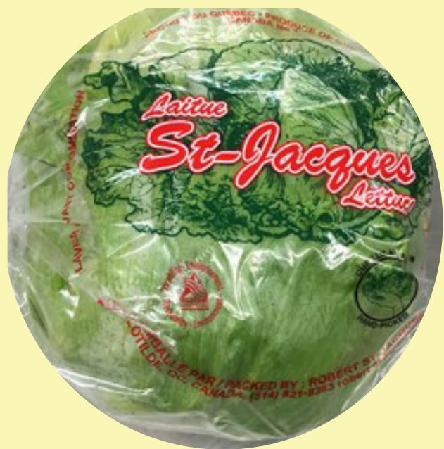
Laitue pomme Gr.24 États-Unis