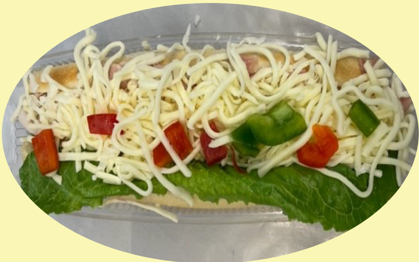
Sous-marin jambon 300g