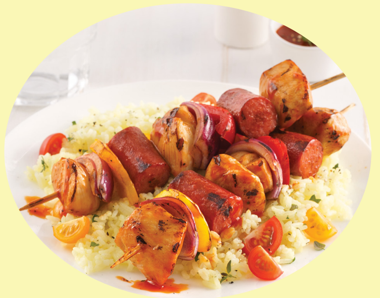
Brochette de boeuf ou brochette de poulet 26.43$/kg