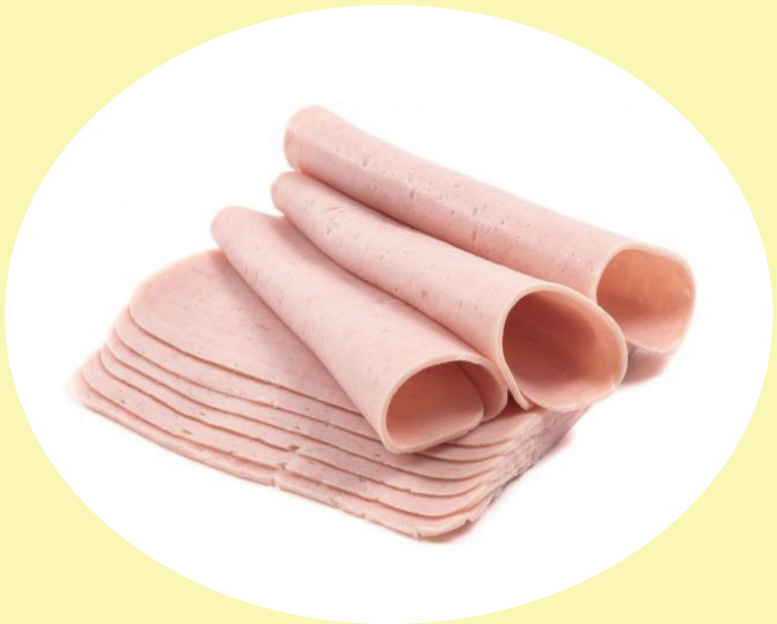
Pain poulet Fortin 16.74$/kg