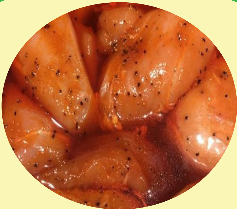
Poulet mariné Chaudière de 10 lb Marinade au choix