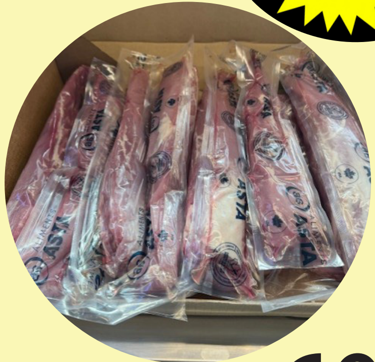
Filet mignon de porc 10 lb