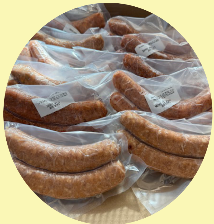
24 saucisses variées (12 paquets de 2) 120g/un