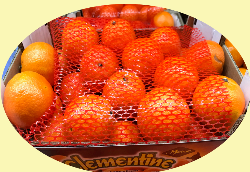
Clementine 4 lb Maroc