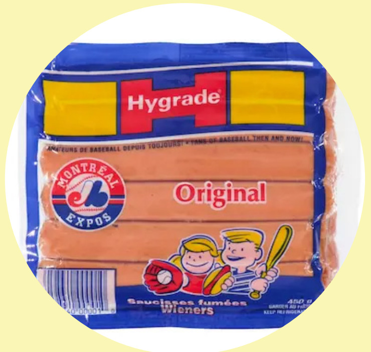
Saucisses fumées original Hygrade 450g