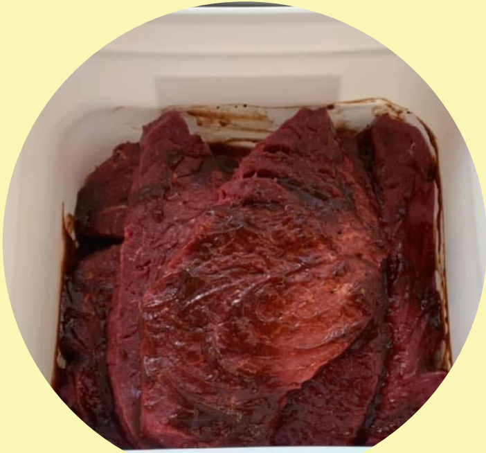
Bifteck français chaudière de 10 lb Marinade au choix