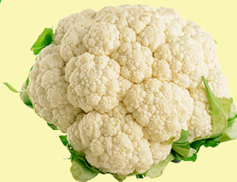
Chou-fleur Gr.12 États-Unis