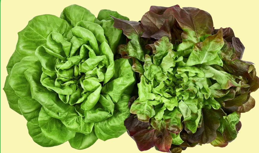
Laitue salonova Canada