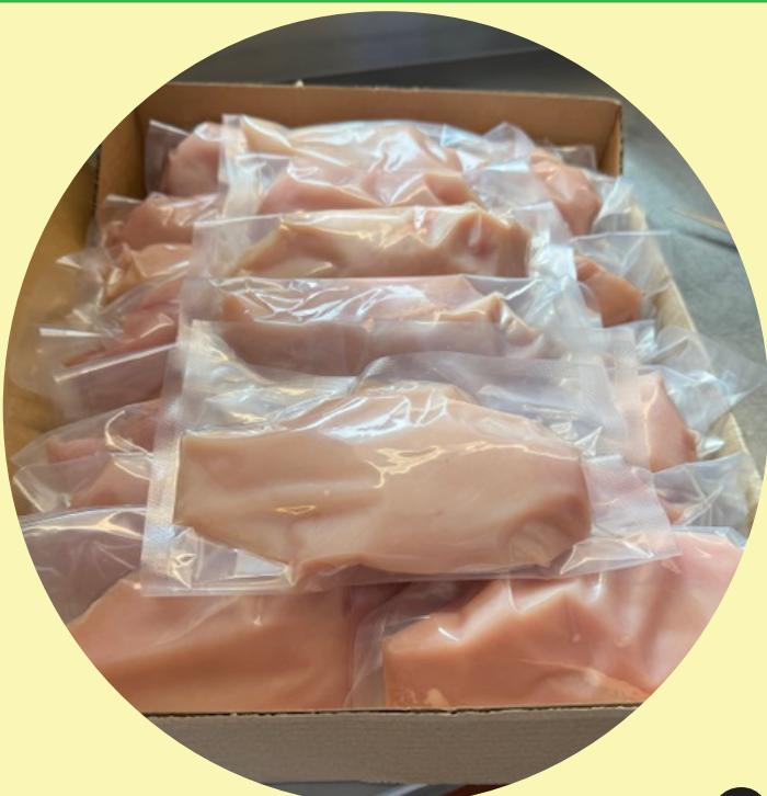
Poitrine de poulet desossée sous-vide 10 lb