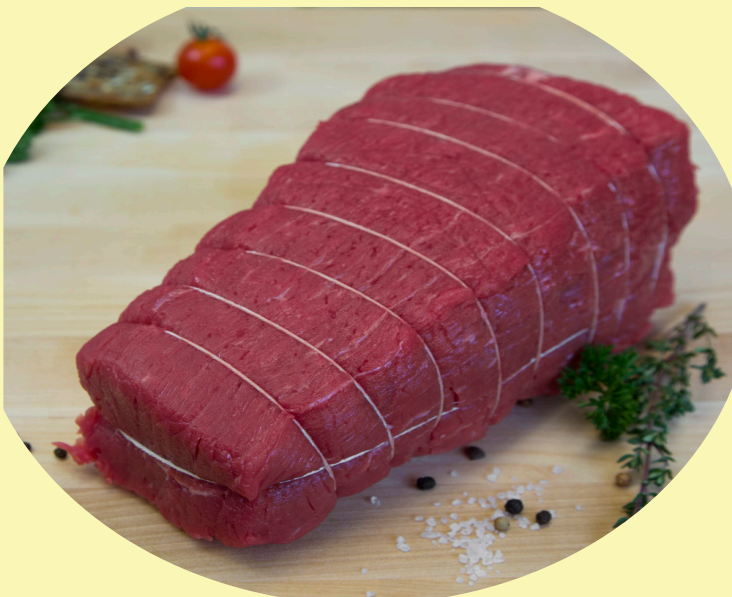
Rosbif français de boeuf 24.99$/kg