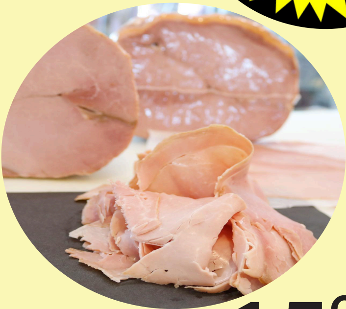
Jambon blanc Perron 35.26$/kg