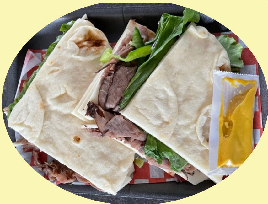
Sandwich pain naan au boeuf 230g