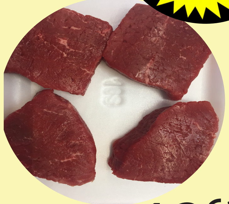
Tournedos boeuf familial 29.99$/kg