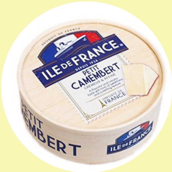
Petit camembert Île de France 125g