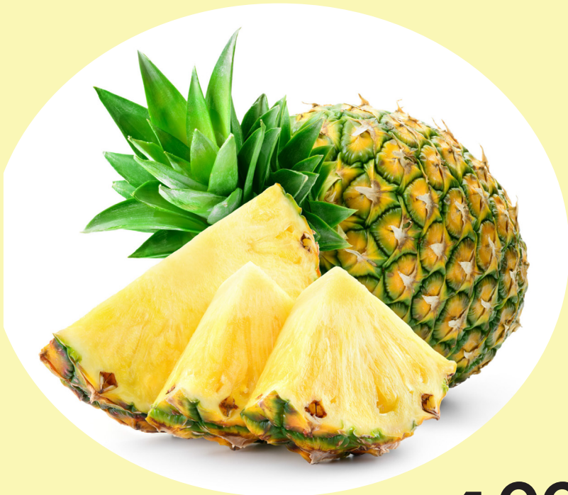
Ananas Gr.6 Costa Rica