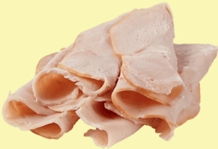
Poitrine de dinde fumée 35.26$/kg