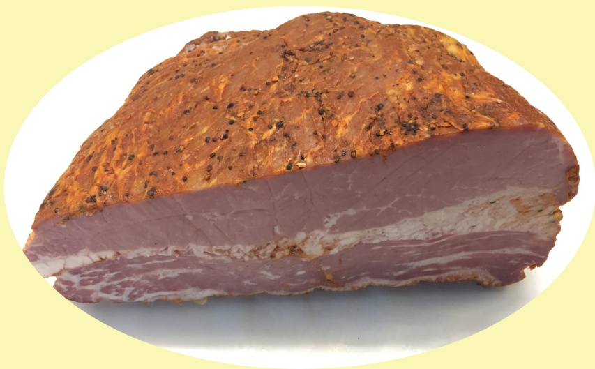
Smoke meat de boeuf 37.46$/kg