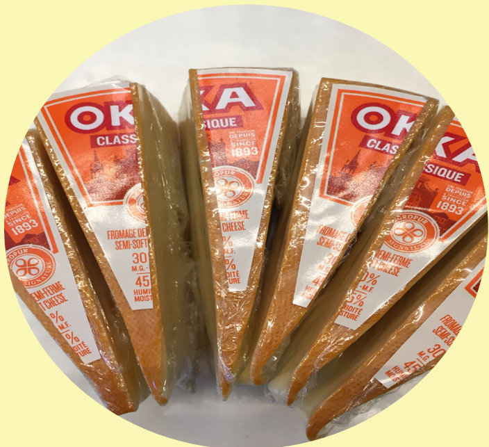
Oka classique 41.87$/kg