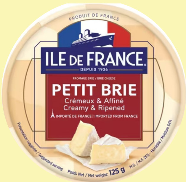
Petit brie Île de France 125g