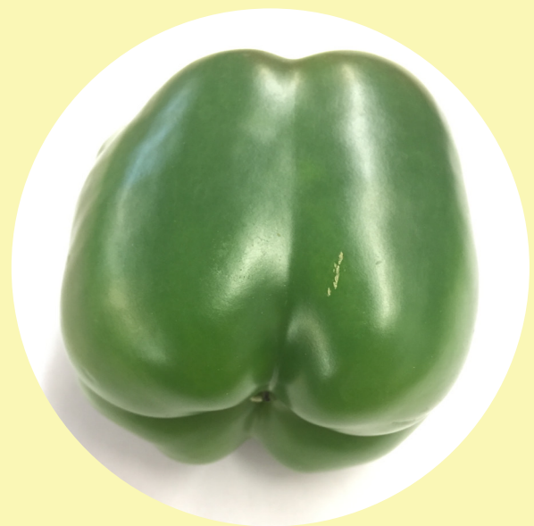
Piment vert États-Unis 4.39$/kg