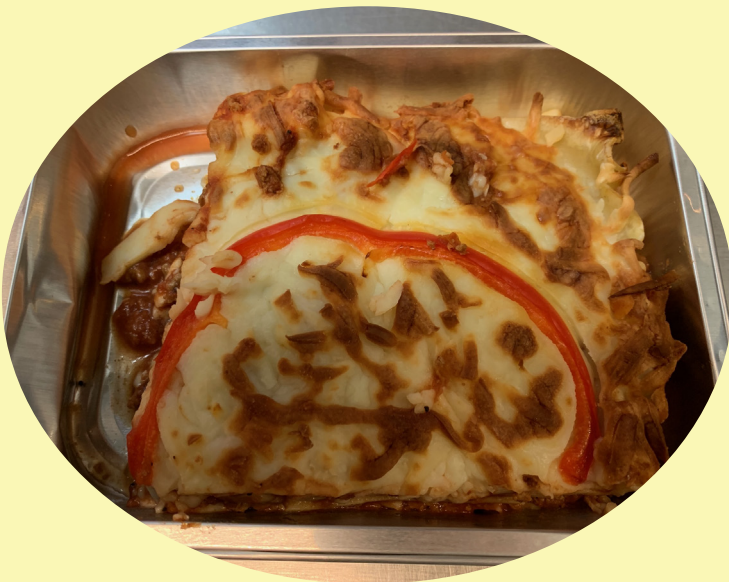
Lasagne Maison corne 22.02$/kg