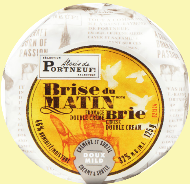
Brise du matin Portneuf 125g