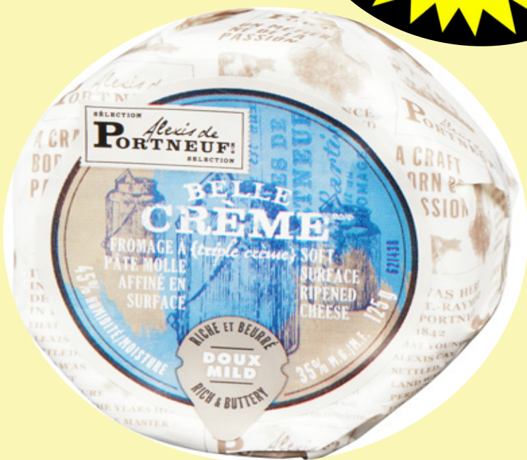
Belle crème Portneuf 125g