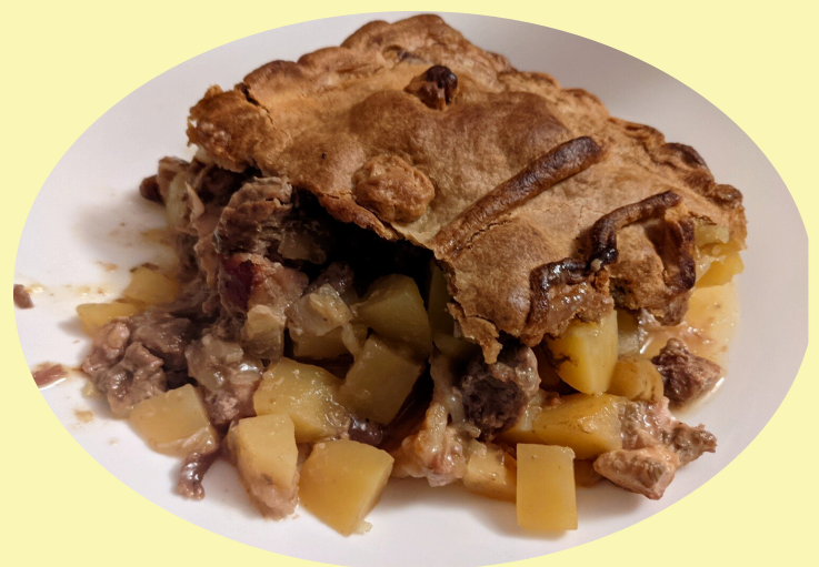
Tourtiere Saguenay Lac-St-Jean 28.64$/kg