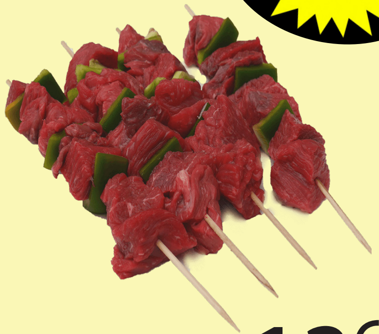
Boeuf brochette Attendri mecaniquement 29.99$/kg