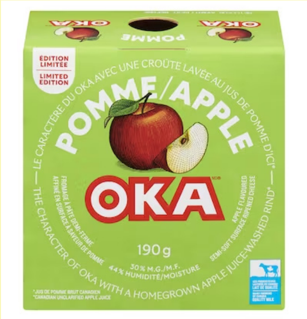
Oka pomme 190g