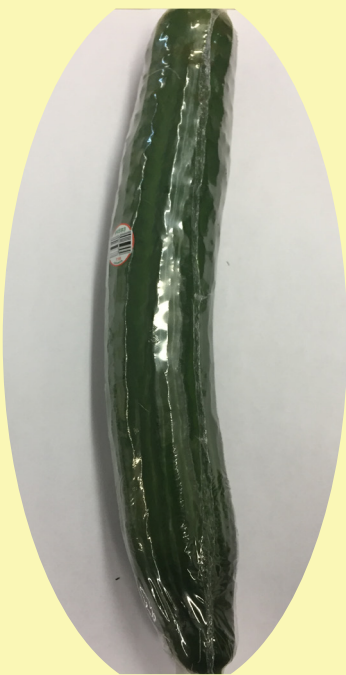
Concombre anglais Quebec/Canada