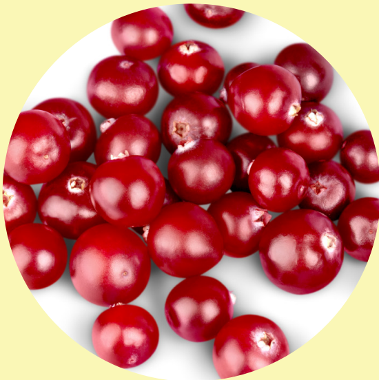
Canneberge 340g Quebec