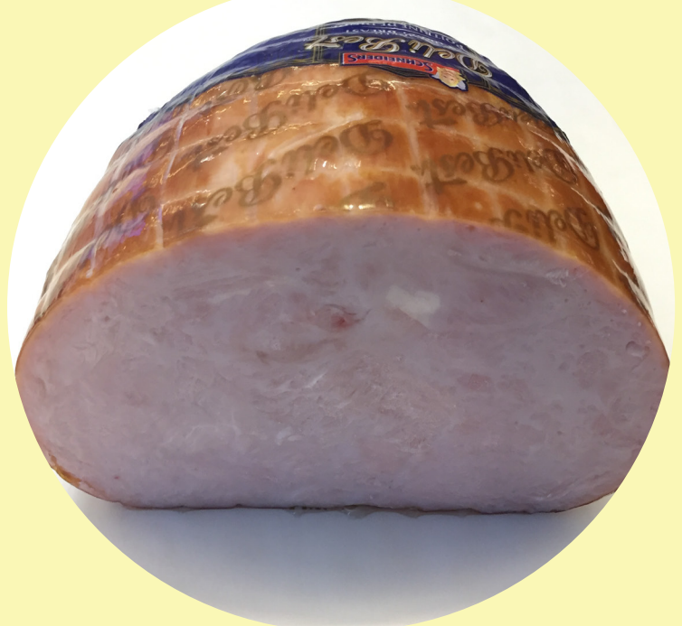
Poitrine de dinde fumée 35.25$/kg