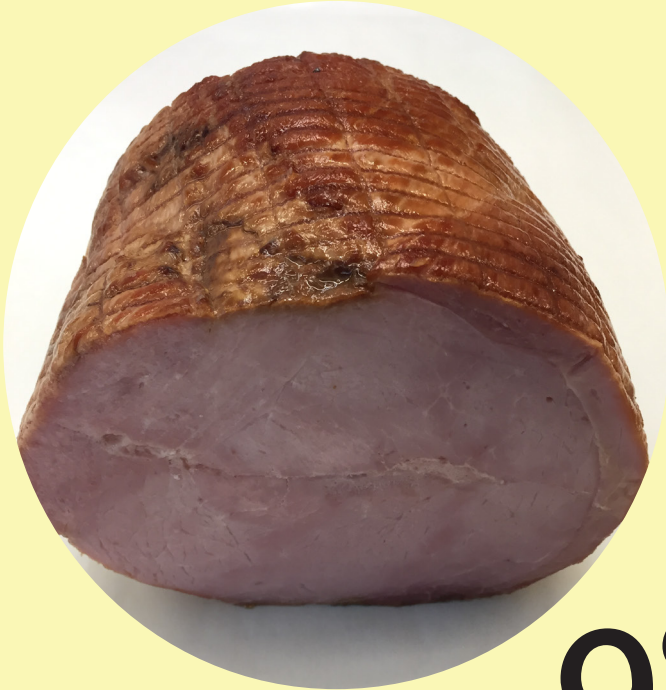
Jambon a l'ancienne fumé etrax-maigre 22.02$/kg