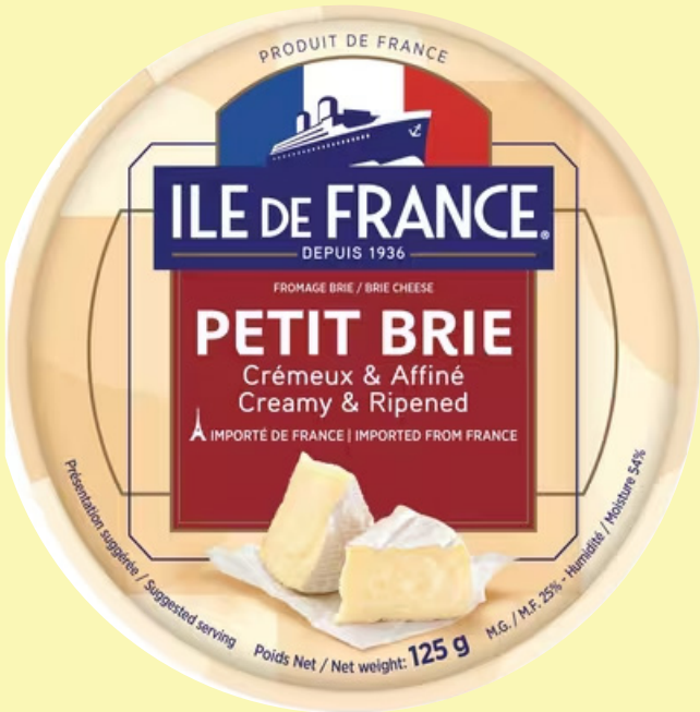
Brie île de France 125g