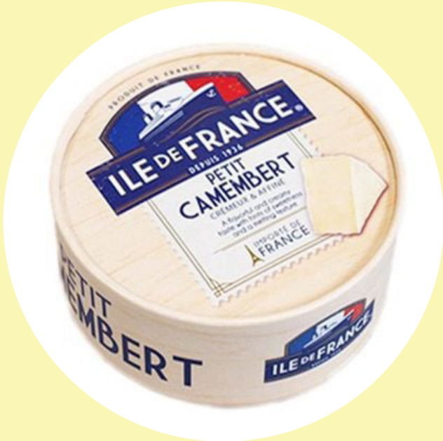
Camembert île de France 125g