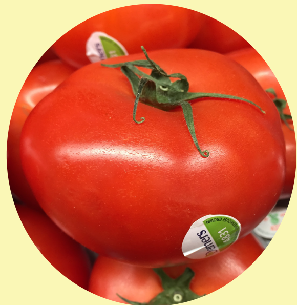
Tomate rouge trio Quebec (serre Demers) 4.39$/kg