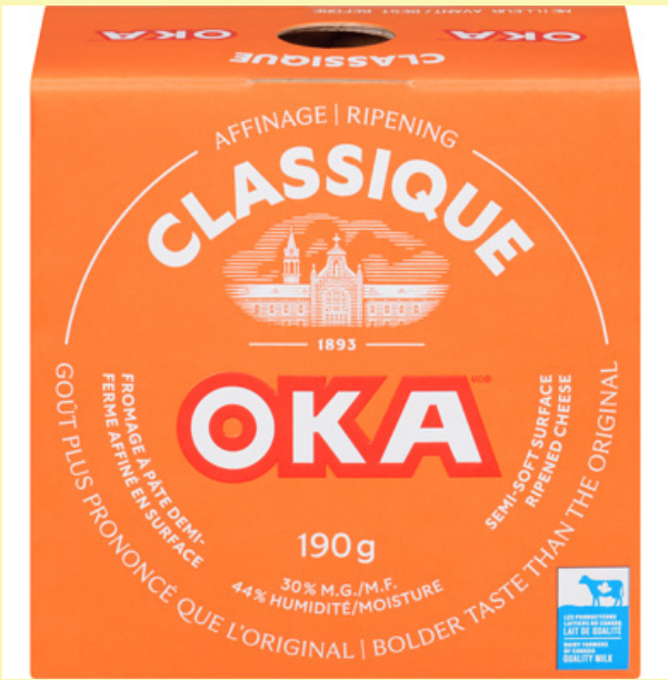
Oka classique 190g