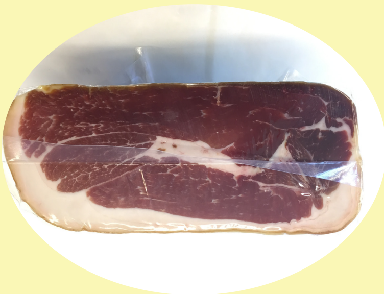
Jambon prosciutto San Daniele 68.22$/kg