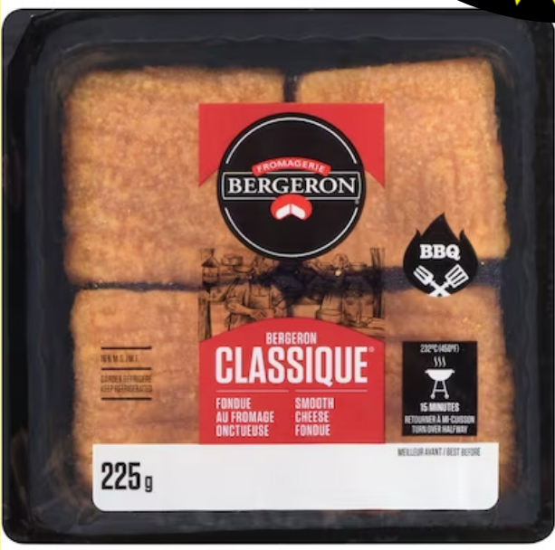
Fondue classique Bergeron 225g