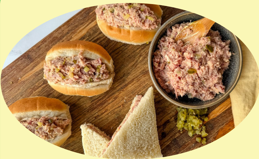
Jambon haché 22.02$/kg