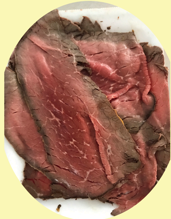
Rosbif boeuf cuit 39.99$/kg