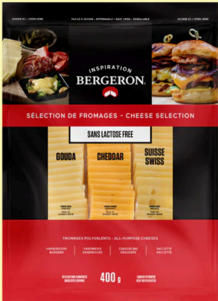
Fromage Bergeron Inspiration 400g