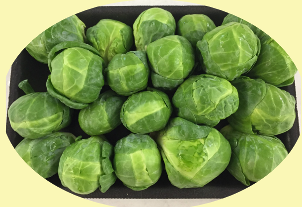
Chou bruxelle Hollande 8.80$/kg