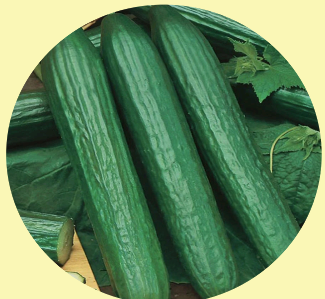
Concombre anglais Canada