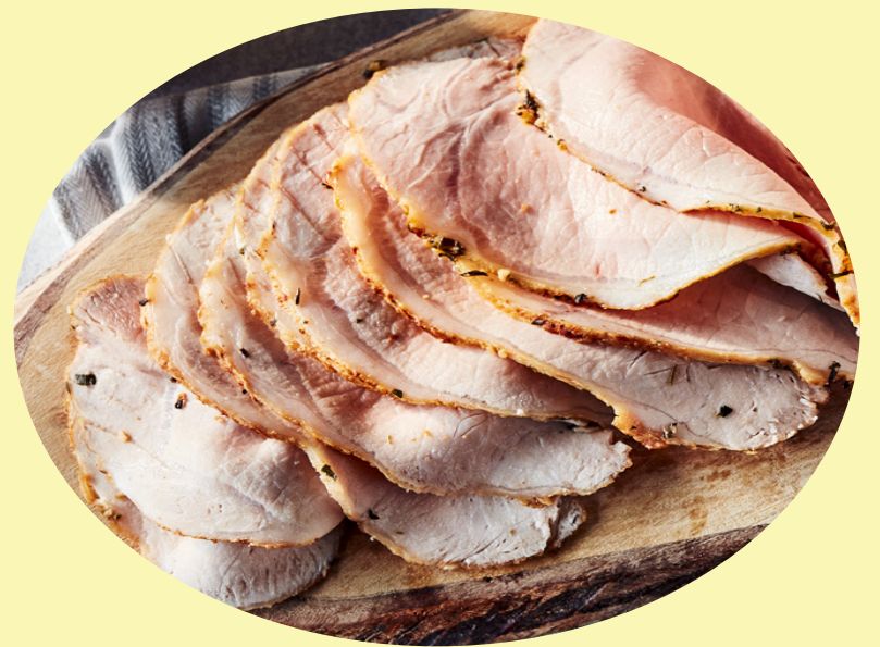
Roti de porc 30.84$/kg