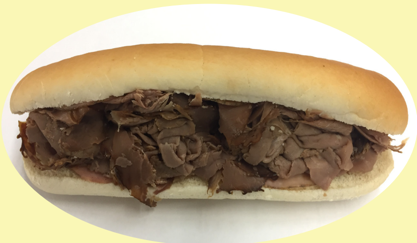
Sous-marin rosbif 225g Maison corne