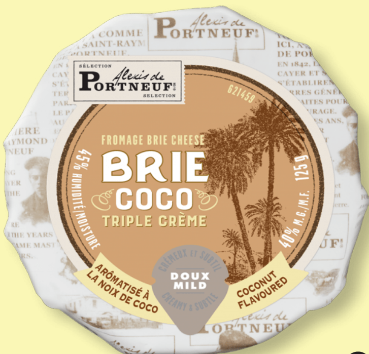
Brie coco Alexi de Portneuf