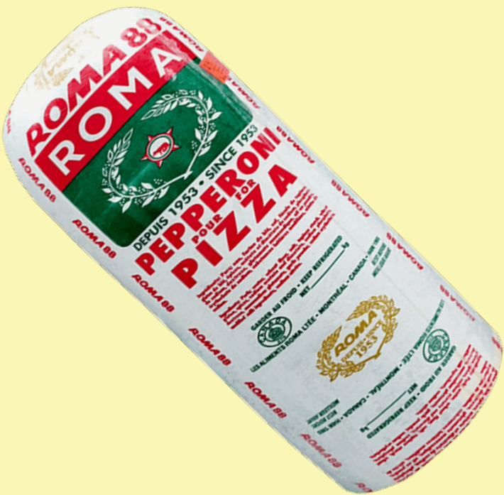
Pepperoni Roma 22.02$/kg