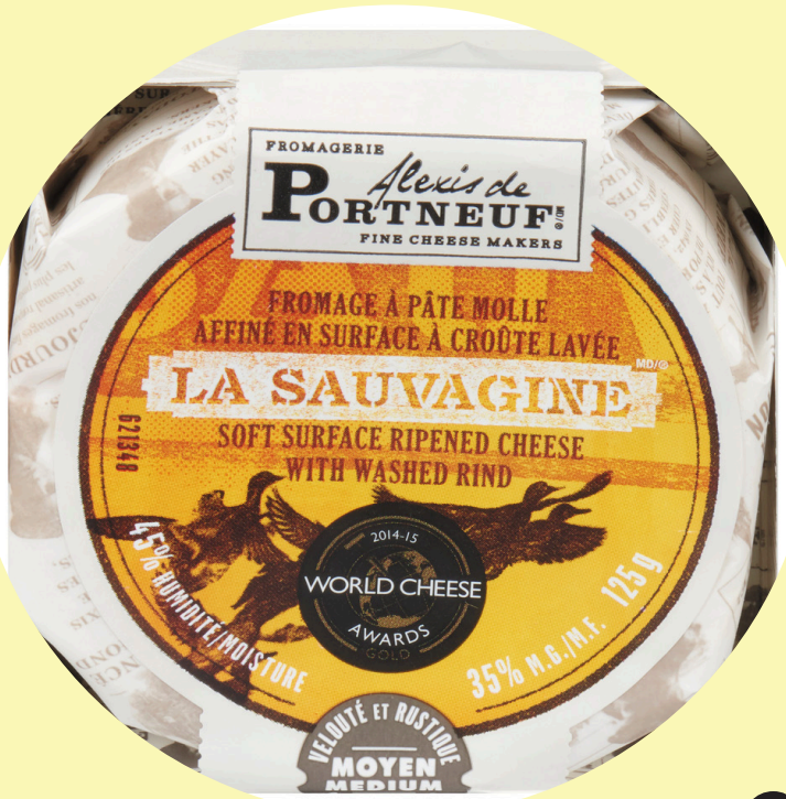
La sauvagine 125g Alexis de Portneuf