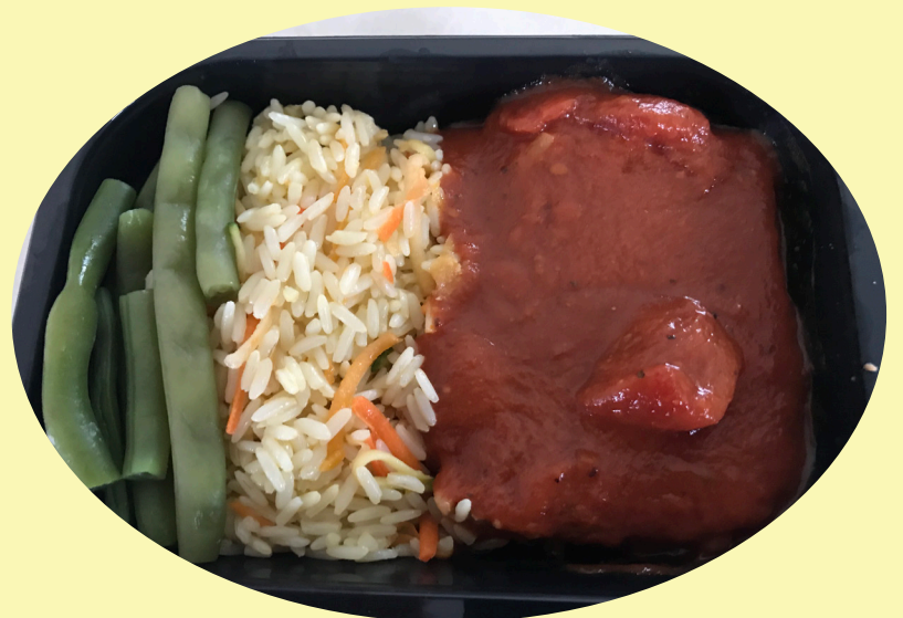
Pain de viande Maison corne 24.23$/kg