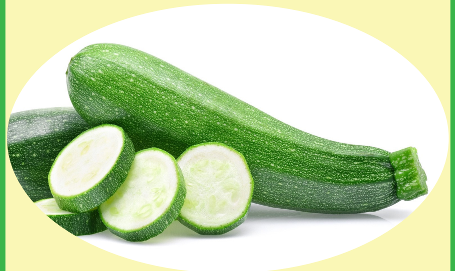
Zuchinni Mexique 6.59$/kg