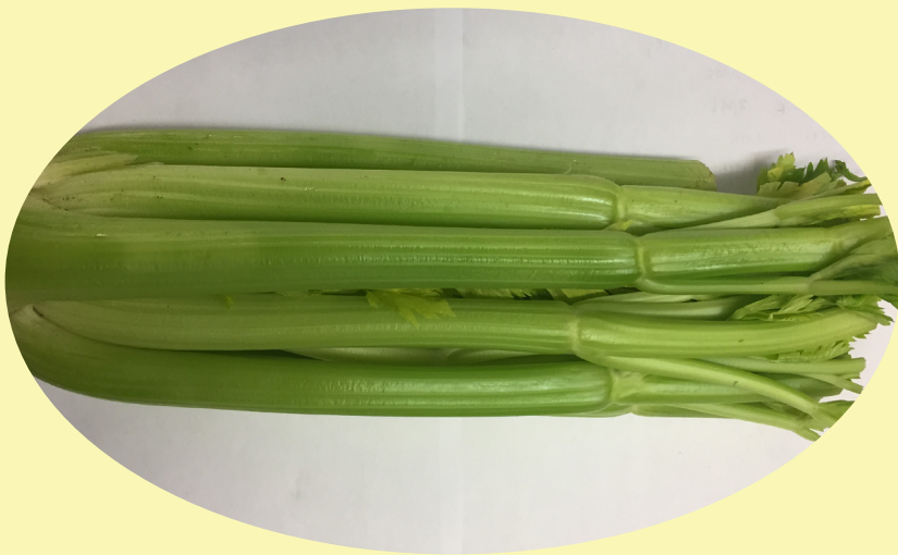
Celeri Gr.24 États-Unis