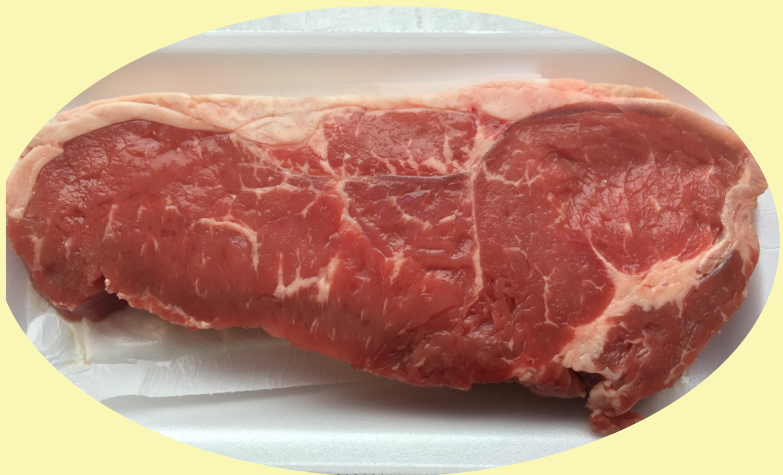
Bifteck contre filet A ou AA 49.99$/kg