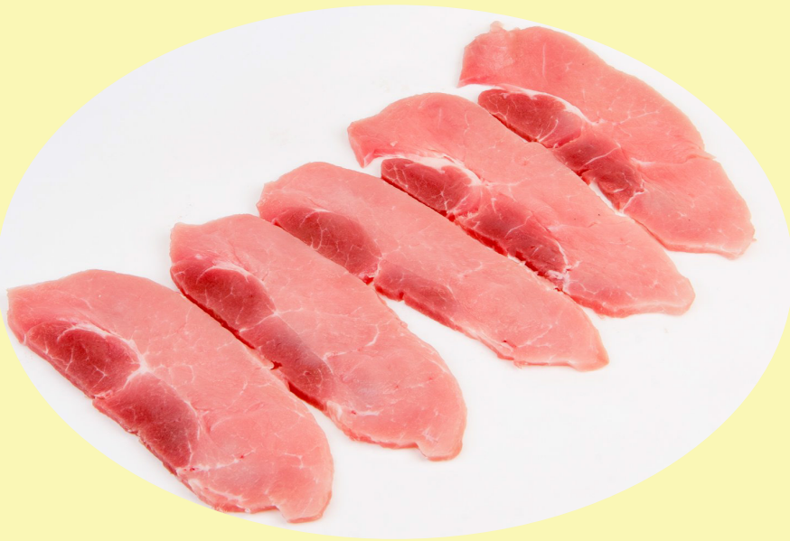
Bifteck de surlonge de porc 8.80$/kg