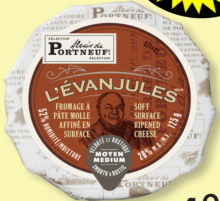
L'évanjules Alexis de Portneuf