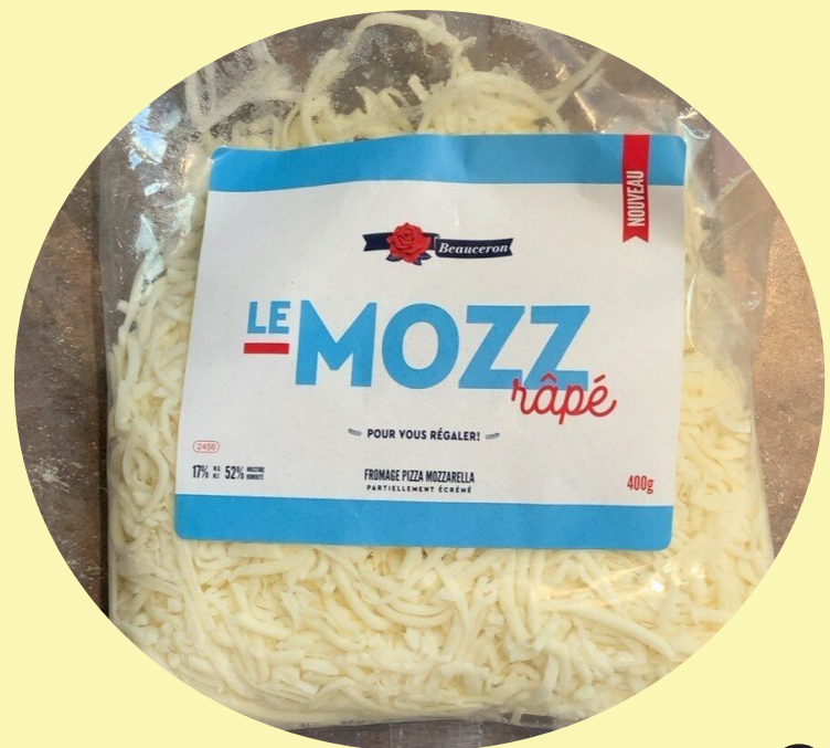
Le Mozz rapé 400g Beauceron