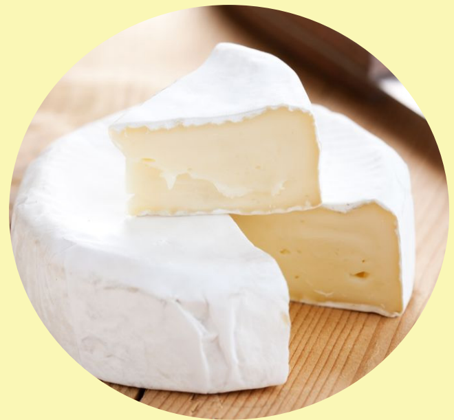
Brie L'Extra double crème (Agropur) 37.46$/kg