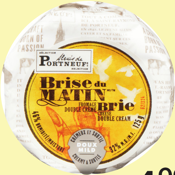
Brise du matin 125g Alexis de Portneuf