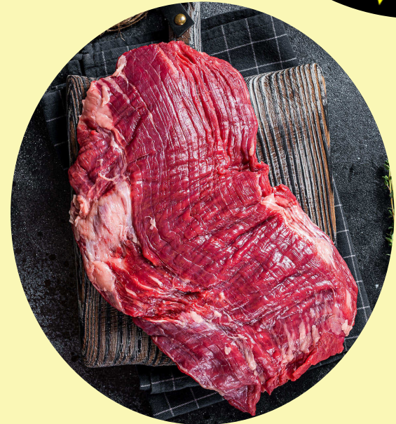
Bavette de boeuf AA 49$/kg