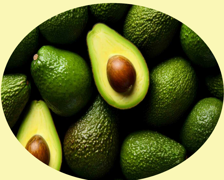
Avocat Gr.16/20 Importé