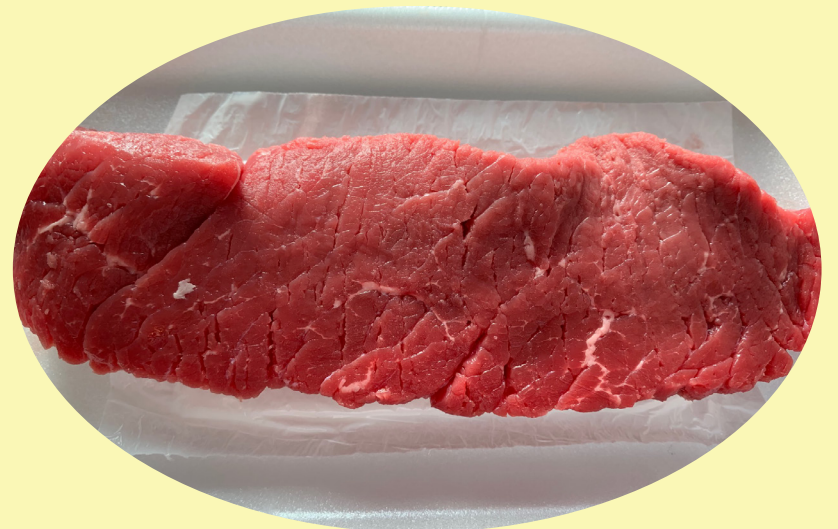
Bifteck français 29.99$/kg