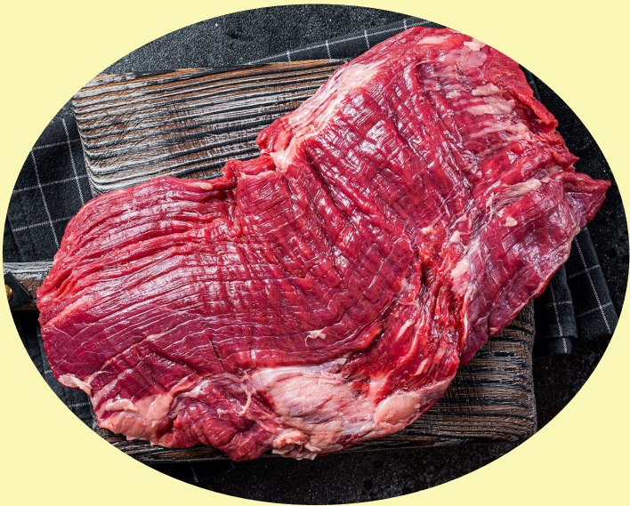
Bavette de boeuf AA 51.99$/kg