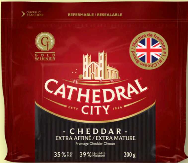
Cathedral City extra mature 200g