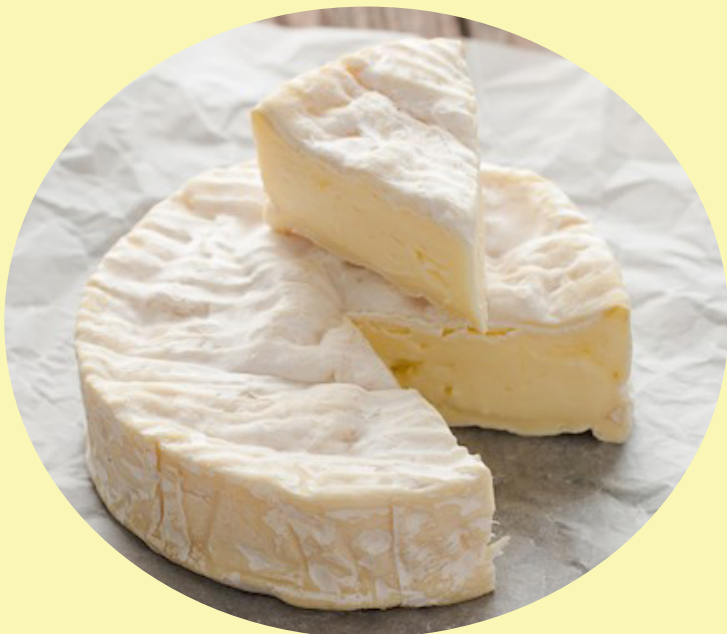
Brie Brise du matin Alexis de Portneuf 125g