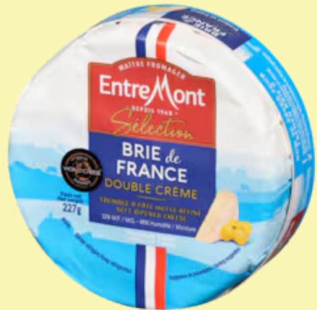
Brie de France Entre Mont 227g