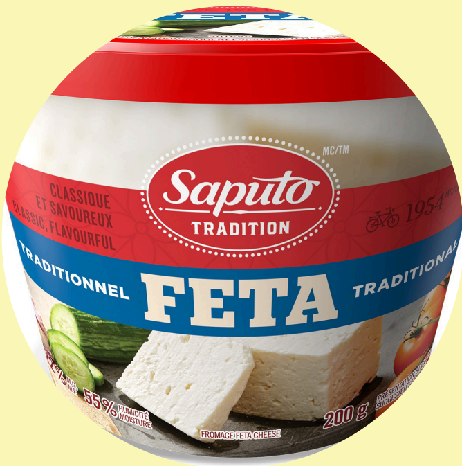
Feta léger ou régulier 200g