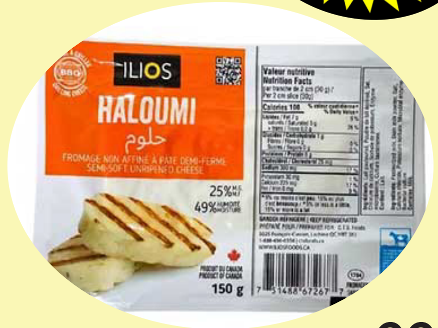
Haloumi Ilios Fromage a griller 150g