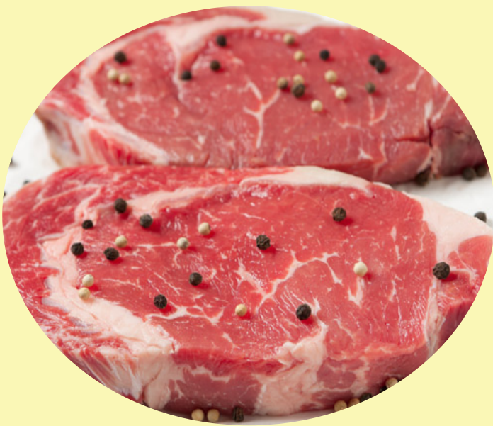
Faux filet angus AAA 59.99$/kg