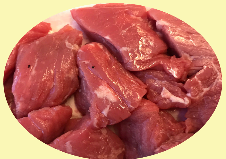
Boeuf fondue bourguignonne 29.99$/kg