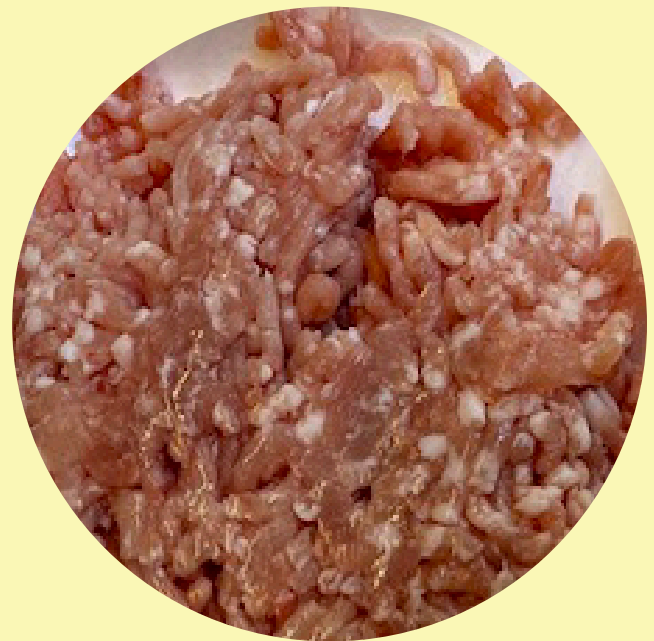
Porc haché frais maigre 8.80$/kg