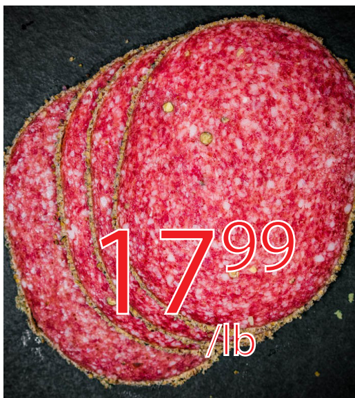
Salami au poivre