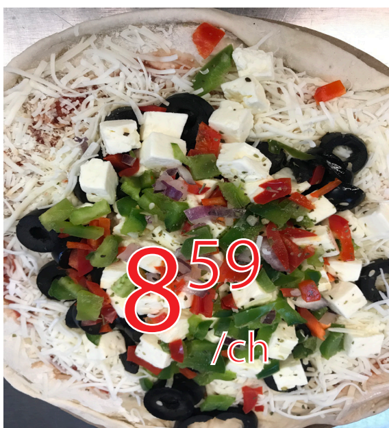
Pizza mince caprice a la grecque 450g Maison corne