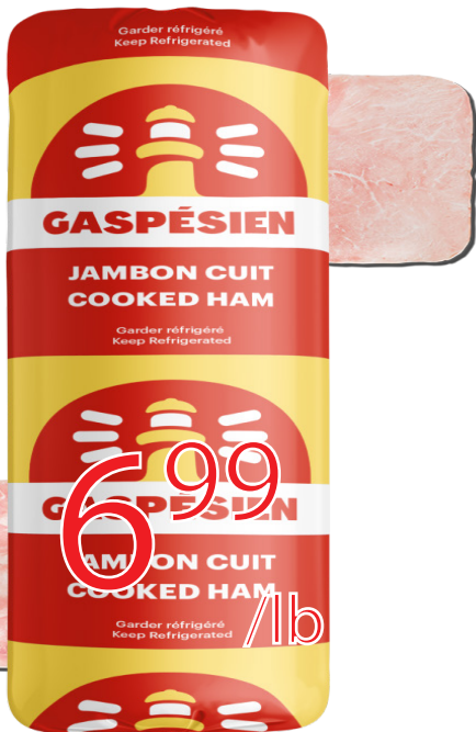
Jambon cuit Gaspésien