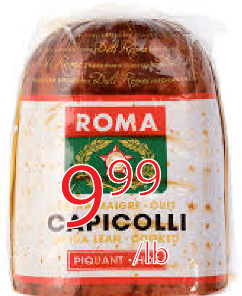
Capicollo fort roma