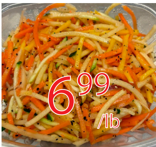
Salade julienne Grec Maison corne