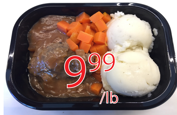
Boeuf haché a l'oignon Maison corne