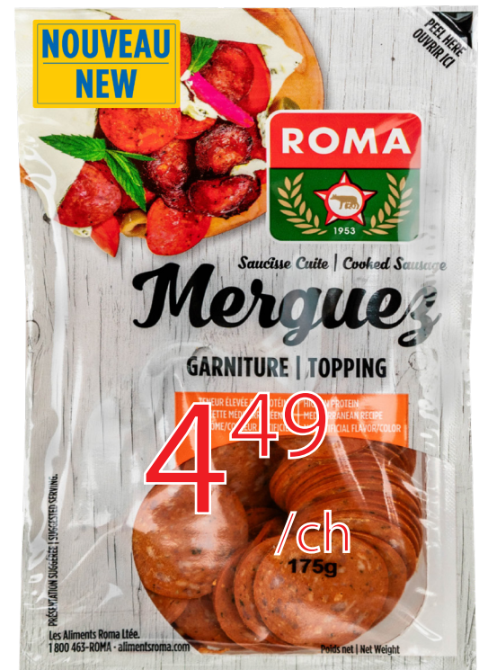
Nouveau Saucisse cuite merguez 175g