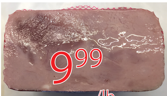
Jambon a l'ancienne fumé extra-maigre