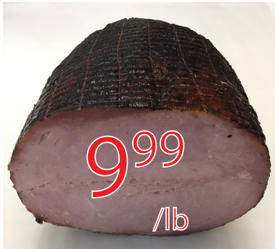
Jambon forêt noire